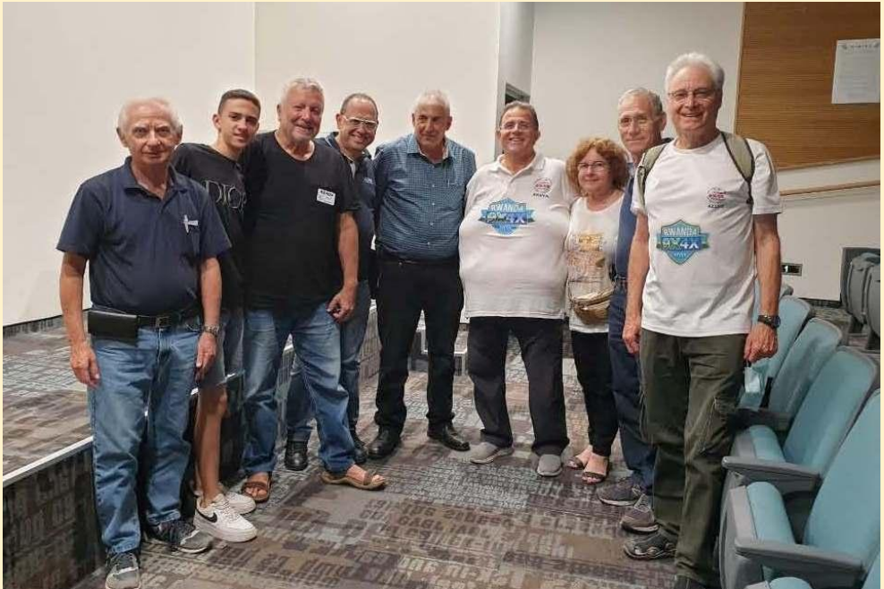
החברים הוותיקים שבאו לבקר במועדון 4X4HQ

תודה רבה למשתתפים במפגש המיוחד ולאלה שהיו שותפים פעילים בערב המוצלח הזה.