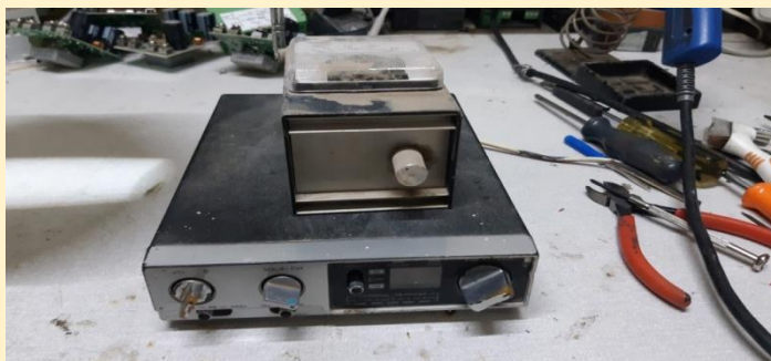
מכשיר הקשר אשר שימש את מערכת ההשקיה מרחוק.

בשנות השבעים של המאה הקודמת כל נושא התקשורת היה בתחילת דרכו (עדין היו רק טלפונים קווים בודדים בקיבוץ – על טלפונים בכתי החברים היה אפשר רק לחלום...)