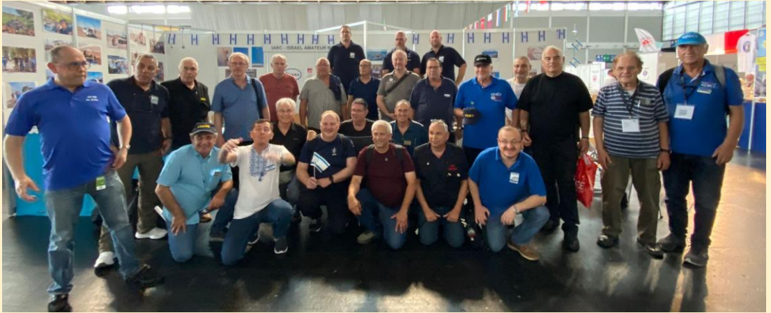
עשרות חובבי רדיו מישראל הגיעו השנה לתערוכה בפרידריכסהפן

לאחר שנתיים שלא התקיימה, עקב מגפת הקורונה, ולאחר מספר חודשי הכנה תערוכת חובבי הרדיו הבינלאומית השנתית שמתקיימת בפרידריכסהפן נפתחה מחדש. בהתרגשות רבה נפגשו חובבים רבים מכל העולם וחלקו חוויות עם עמיתיהם וניכר שלאחר כה רב של בצורת הצמא היה רב.