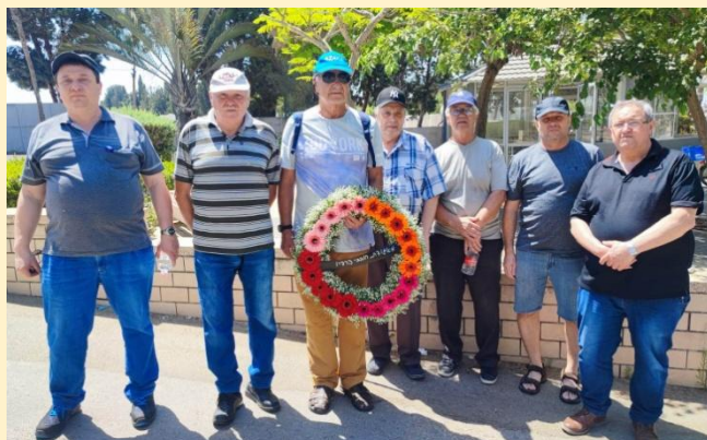
חברים עם זר מאת אגודת חובבי הרדיו בישראל