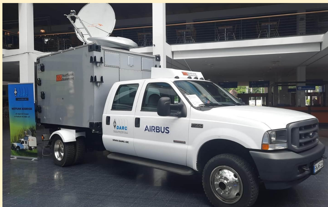
אגודת חובבי הרדיו הגרמנית ה-DARC הציגה את רכב תקשורת החירום החדש שלהם הפועל בכל המודים האנלוגיים והדיגיטליים עם אנטנות לקשר אלחוטי ולווייני ב-HF, VHF, UHF וכן SHF