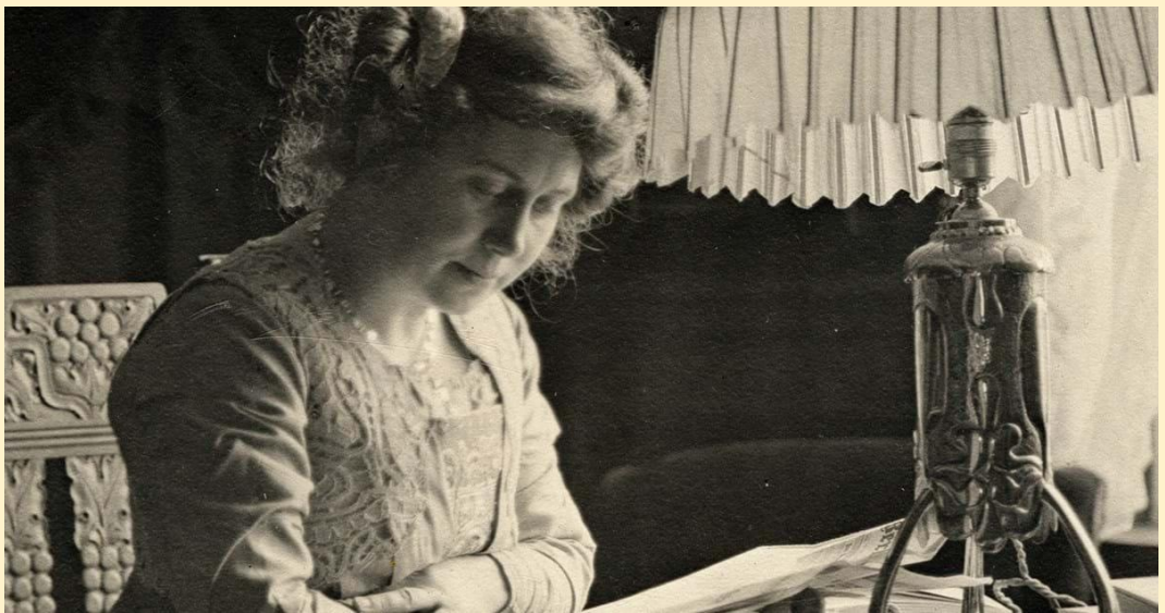
הסופרת הזדנית קארין מיכאליס, 1872 - 1950

מופלאים בשם "חסמב"ה", (חבורת סוד מוחלט בהחלט), אותם כתב יגאל מוסינזון. אני גיליתי הסתייגות מהסדרה הזו, שכן, באותה תקופה הופיעו סיפורי ילדים על "כושי סמבו", ואני קישרתי אותם לכושים הקטנים שתקפו את רובינזון קרוזו הגיבור... ספרי חסמב"ה יצאו לאור מדי פעם, וילדים רבים רצו לקיסקים כדי לרכשם. לבסוף, גם אני קראתי פרק אחד, והוקסמתי בעיקר מהמערה החשמלית אשר שימשה את הנערים המופלאים הגיבורים שנלחמו בבריטיים, בערבים ובעבריינים. מה היה שם במערה החשמלית? לדעתי היו שם רק לחצן עם פעמון, ואולי טלפון פנים, אך זה היה אוצר גדול במדינה בה המתינו 8 שנים על מנת לקבל קו טלפון. באחד הימים אחרי הצהריים, יצאתי לרחוב כדי לחפש ילדים מהשכונה עימם אוכל לשחק. היה יום חם, ונכנסתי לחצרות הבתים כדי לראות האם מישהו יצא לקראתי. לפתע ראיתי על האדמה מונח ספרון ירוק וישן בשם "האי הירוק". מישהו כנראה השליך אותו לחצר. הרמתי את הספר והתחלתי לקרוא בו. היה זה ספר לנוער בהוצאת "הקיבוץ המאוחד" משנת 1945, שתורגם מהשפה הזדנית, שנכתב על ידי הסופרת קארין מיכאליס בשנת 1933. היה זה כמעט הספר הראשון העוסק במדע בדיוני אותו קראתי. השנה ממש נערכות חגיגות לציון יום הולדתה ה-150 של קארין מיכאליס, שנחשבת עד היום לאחת הסופרים/ות הדגולים בדנמרק.